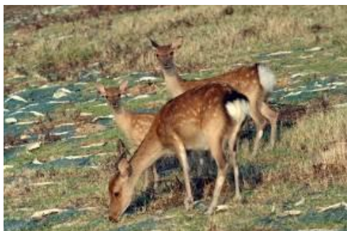
島で暮らすニホンジカたち

小値賀町は、九州の西にある五島列島の北部に位置する大小17（内無人島10島）の島々でできていて、そのほぼ全域が西海国立公園に指定されています。気候が穏やかで風光明媚、魚介類も豊富。そしてやさしい人がいっぱい住む島。それが小値賀です。