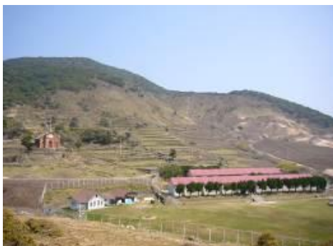
キャンプ地の野崎自然学塾村