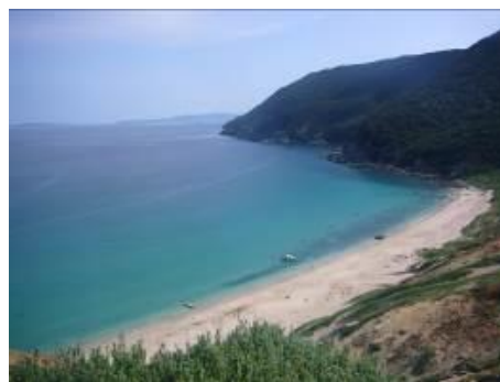
キャンプが開催される野崎島