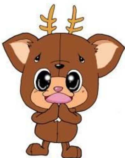
小値賀のご当地キャラクター ちかまるくん