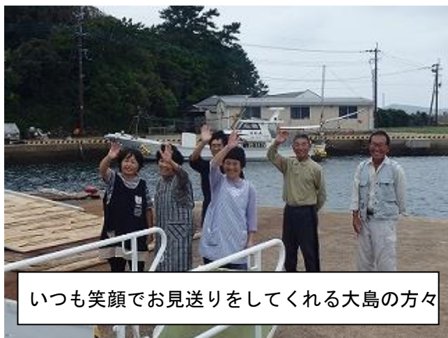
いつも笑顔でお見送りをしてくれる大島の方々