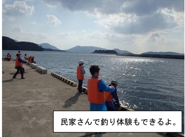
民家さんで釣り体験もできるよ。