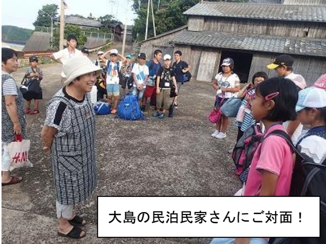
大島の民泊民家さんにご対面！