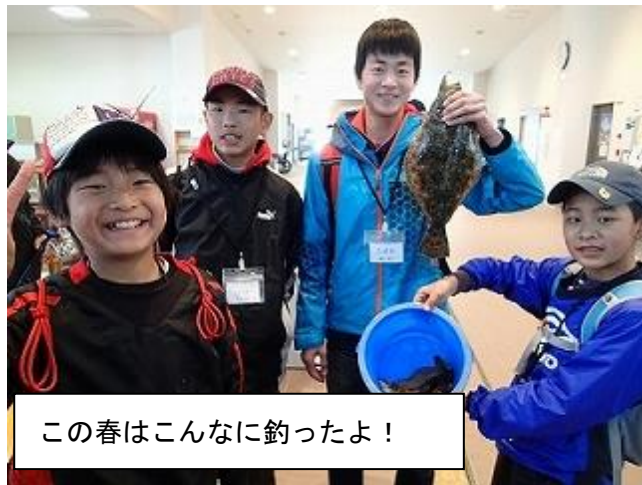
この春はこんなに釣ったよ！