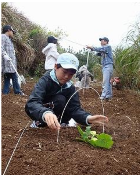
小学校の前の畑を農園に開墾する予定だよ！