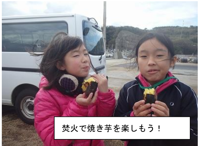
焚火で焼き芋を楽しもう！