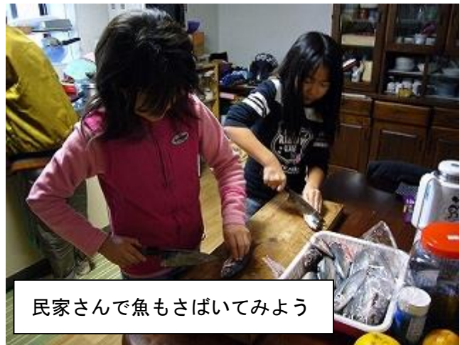
民家さんで魚もさばいてみよう