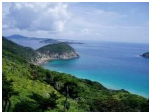
キャンプが開催される野崎島