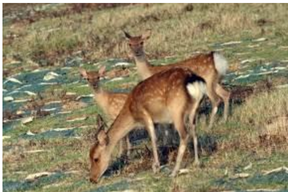
島で暮らすキュウシュウジカたち

小値賀町は、九州の西にある五島列島の北部に位置する大小17（内無人島10島）でできた島です。そのほぼ全域が西海国立公園に指定されています。気候が穏やかで風光明媚、魚介類も豊富。そしてやさしい人がいっぱい住む島。それが小値賀です。