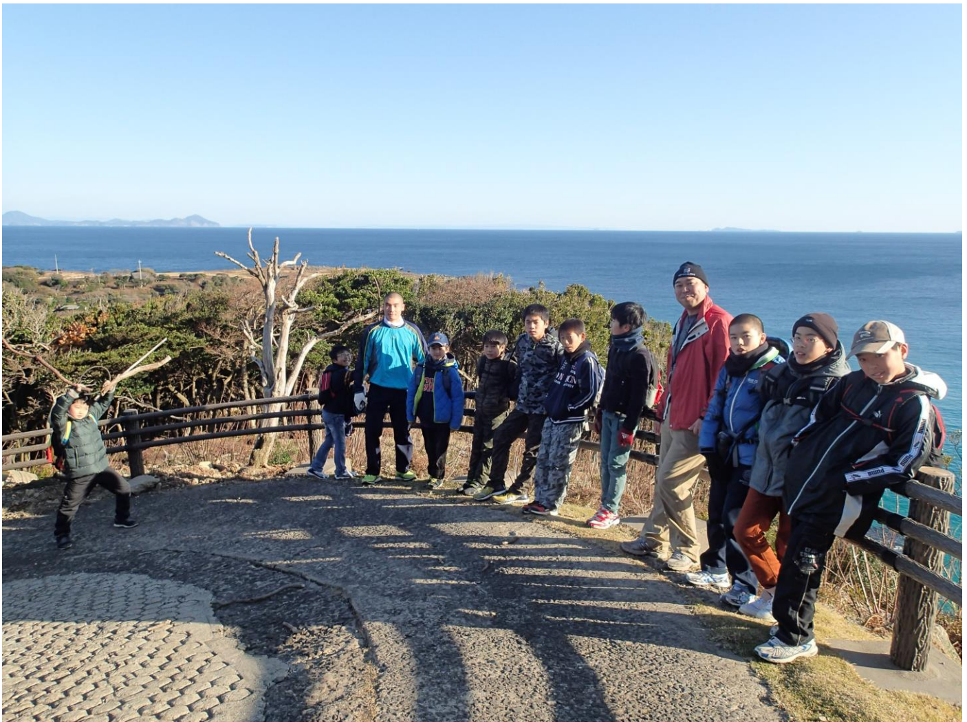
(写真は2014年冬の宝島キャンプのもの)