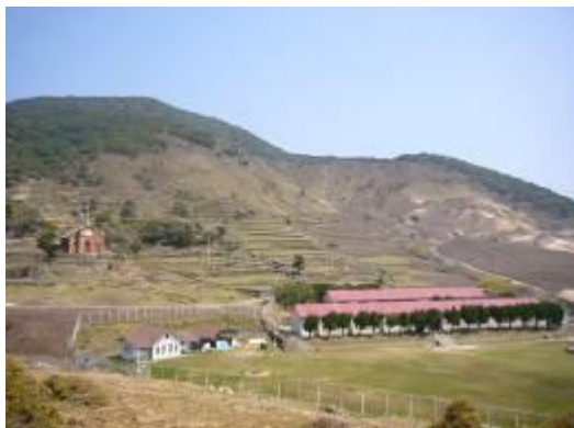
キャンプ地の野崎自然学塾村